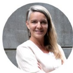
Liebes Vereinsmitglied Liebe Leserin, lieber Leser

Mit dem Juni wächst die Vorfreude auf die Ferienzeit.